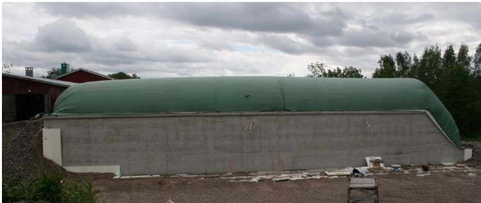
Kuivamädätyslaitos, Kuva: www.metener.fi